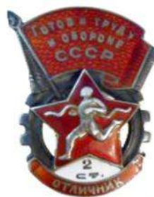
Значки «Отличник ГТО» 2 ступени 1940-1946 годов (серебро и бронза)