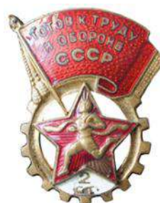
Значки ГТО I и 2 ступеней 1946 – 1961 годов