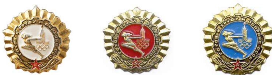
В 1980 году была выпущена специальная серия значков ГТО, посвящённая Играм XXII Олимпиады в Москве