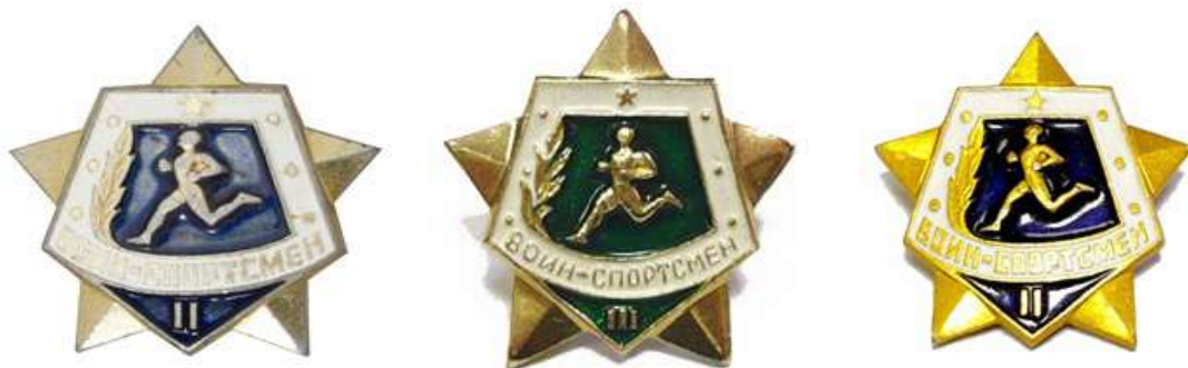
Значки «Воин-спортсмен» I, II и III ступеней, 1961 год