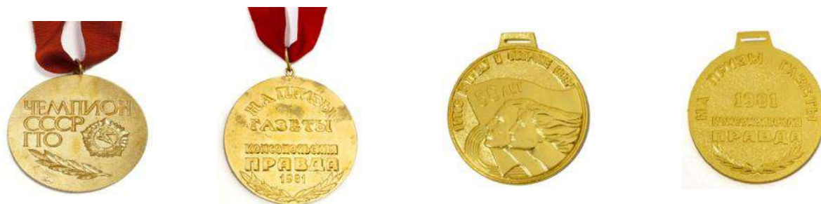
Значок и медали чемпионата СССР по многоборью комплекса ГТО на призы газеты «Комсомольская правда», Кишинёв, 1981 год