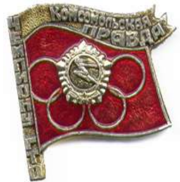
Значок «Чемпиону ГТО», Алма-Ата, 1979 год