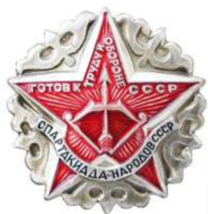
Значок региональных соревнований ГТО – Спартакиада народов СССР»