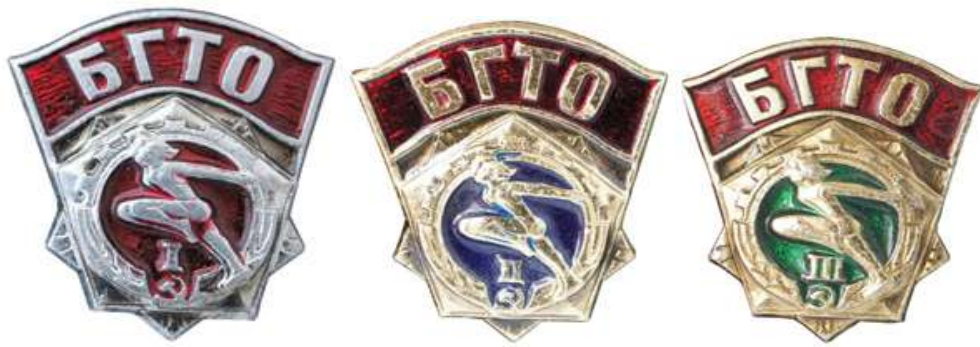
Значки БГТО I, II, III ступеней выпуска 1972 года