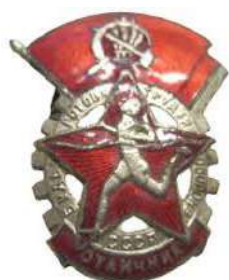
Значок ГТО 1 ступени