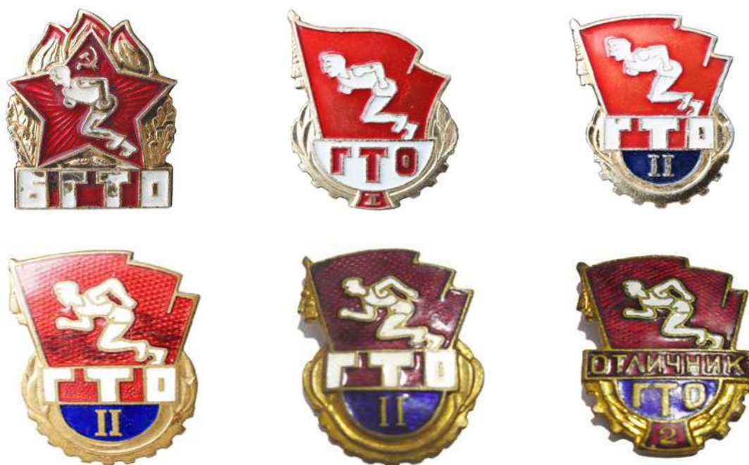
Значки БГТО и ГТО 1961 года

Обновленный Комплекс ГТО состоял из трех ступеней. Ступень БГТО - для школьников 14 - 15 лет, ГТО 1-й ступени - для юношей и девушек 16-18 лет, ГТО 2-й ступени - для молодежи 19 лет и старше.