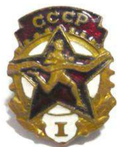
Значки «Будь готов к труду и обороне»