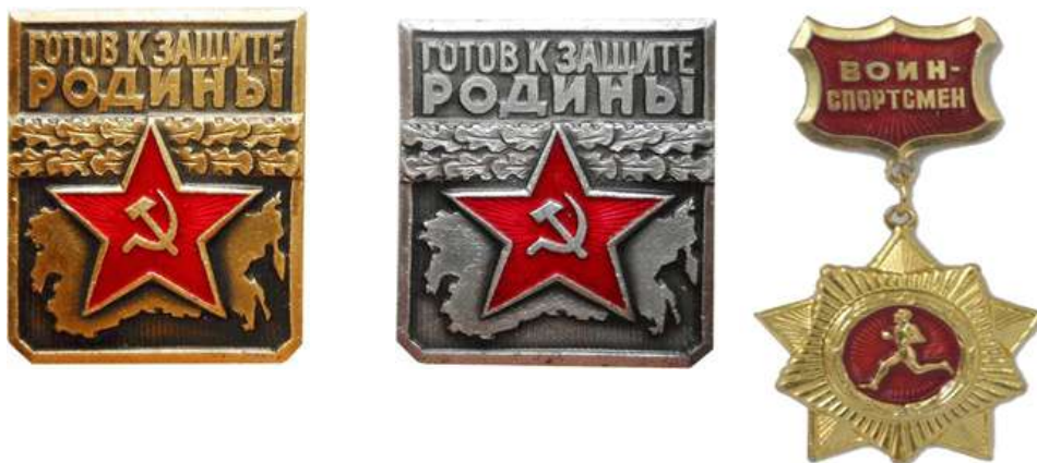
Золотой нагрудный знак «Воин-спортсмен», 1961 год

В 1966 году по инициативе ДОСААФ была разработана и введена в действие ступень комплекса ГТО для молодежи призывного возраста «Готов к защите Родины» (ГЗР).