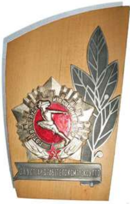
Знак «За успехи в работе по комплексу ГТО»