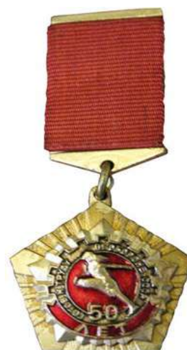
Знак «50 лет комплексу ГТО»