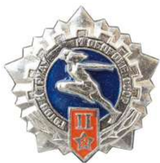
Значки ГТО в редакции 1985 года

В начале 1985 года в Комплекс ГТО был внесен очередной пакет с изменениями. Теперь комплекс для взрослых состоял из 3 ступеней, а для школьников—из 4-х.